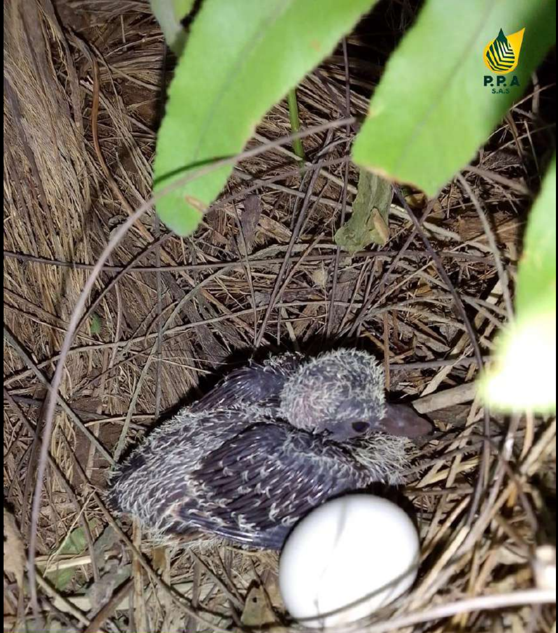
Lote 2 #3 NACÍ PARA BRILLAR YORLEDYS DURAN