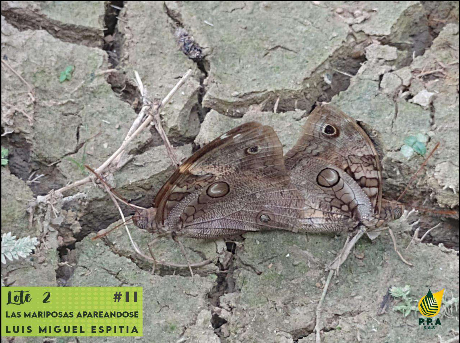
Lote 2 #11 LAS MARIPOSAS APAREANDOSE LUIS MIGUEL ESPITIA