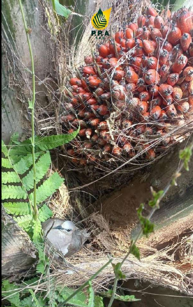
Lote 20 #4 NIDADA PERFECTA VIVIANA VALLEJO