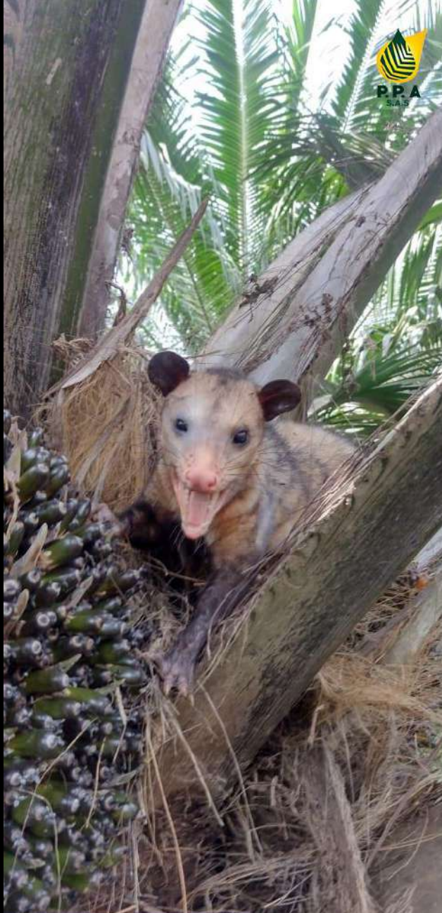
Lote 1 #29 LA PROTECTORA ARMANDO GONZALEZ V