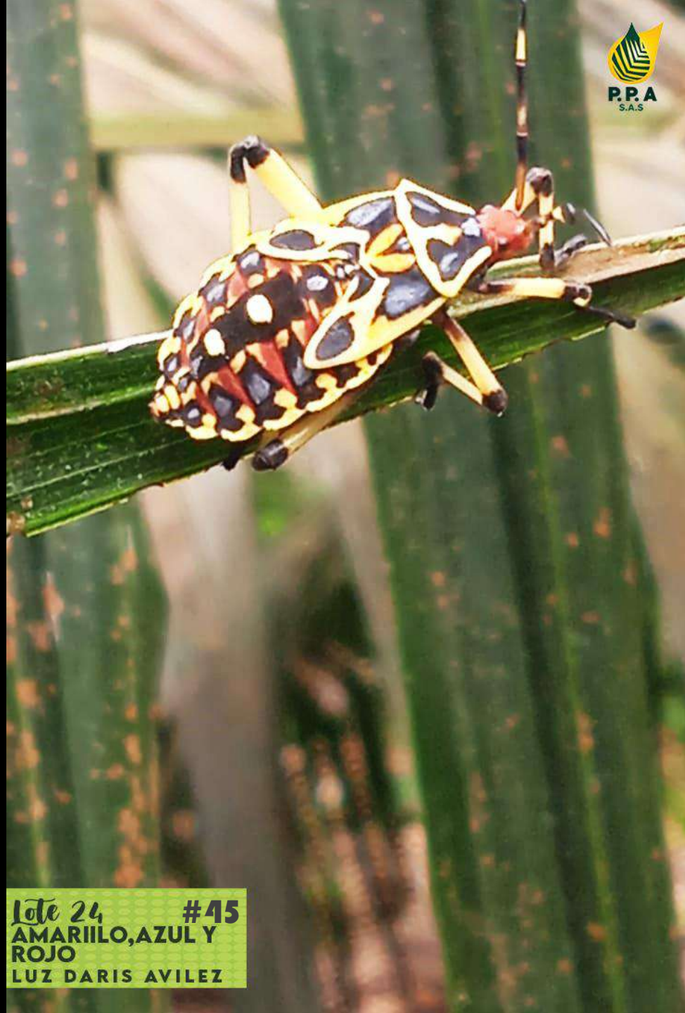
Lote 24 #45 AMARILO, AZUL Y ROJO LUZ DARIS AVILEZ