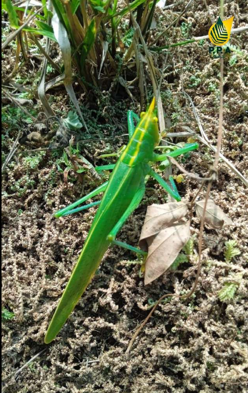
Lote 9 #13 PEPITO GRILLOTE EDUARDO GIRALDO